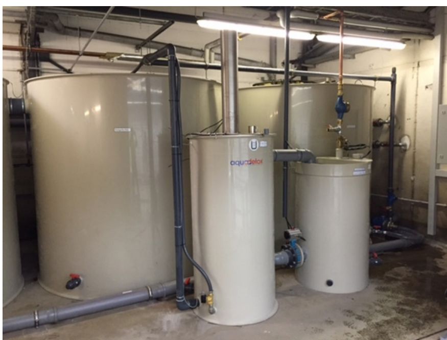
Installation BioSimplex® Ciron

Procédé de fonctionnement : biologique Capacité journalière : 5'000 - 60'000 l/h Réutilisation de l'eau épurée: oui