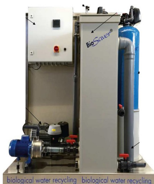
Installation BioSimplex® Saver