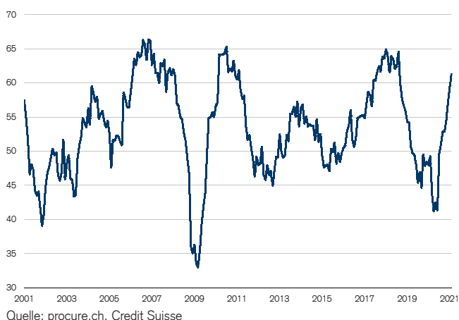
Abb. 1: Industrie-PMI weit über der Wachstumsschwelle Wachstumsschwelle = 50

Wichtige Informationen: Dieser Bericht bildet die Ansicht des CS Investment Strategy Departments ab und wurde nicht gemäss den rechtlichen Vorgaben erstellt, welche die Unabhängigkeit der Investment-Analyse fördern sollen. Er ist kein Produkt des Credit Suisse Research Departments, auch wenn er sich auf veröffentlichte Research-Empfehlungen bezieht. Die CS verfügt über Weisungen zum Umgang mit Interessenkonflikten einschliesslich solcher, die den Handel vor der Veröffentlichung von Investment-Analysedaten betreffen. Diese Weisungen finden auf die in diesem Bericht enthaltenen Ansichten der Anlagestrategen keine Anwendung.