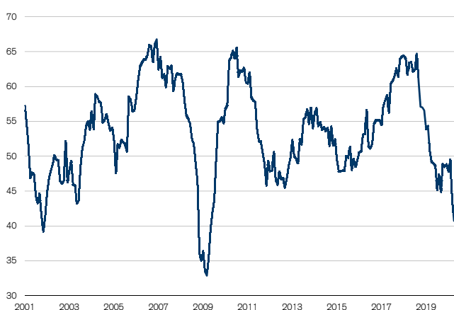
Fig. 1: PMI industrie au-dessus du seuil de croissance Seuil de croissance = 50

L'indice des directeurs d'achat (PMI) procure.ch pour l'industrie a franchi le seuil de croissance de 50 points en août (cf. fig. 1). À 51,8 points, il atteint son plus haut niveau depuis 18 mois et pointe de nouveau en zone de croissance pour la première fois depuis mars 2019.